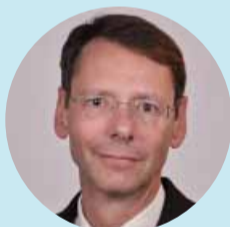
Alfred Wagenhofer Universität Graz